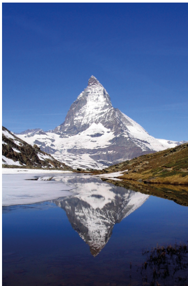
Blick vom Riffelsee auf das Matterhorn