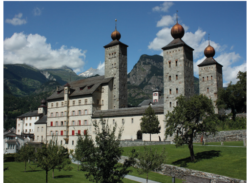
Blick vom Hotel auf das Stockalperschloss

Wir wohnen im ***-Sterne-Schloßhotel Art Furrer in Brig. Die ruhige und schöne Lage direkt neben dem Stockalperschloss ist einzigartig. Lift vorhanden.