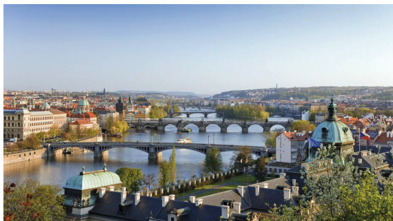
Prag, die "Goldene Stadt"

Unser Hotel Das ***-Sterne Hotel Zvikov befindet sich im gleichnamigen Ort Zvikov (Klingenberg) am Moldausee Orlik.